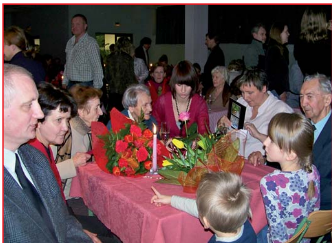
Przy wspólnym stole zasiadła wielopokoleniowa rodzina

20 lutego br. odbyło się uroczyste spotkanie par małżeńskich obchodzących swoje złote i diamentowe gody. O imprezie tej piszemy na str. 4.