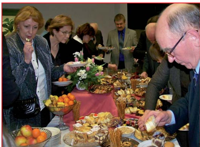
Był poczęstunek i lampka szampana