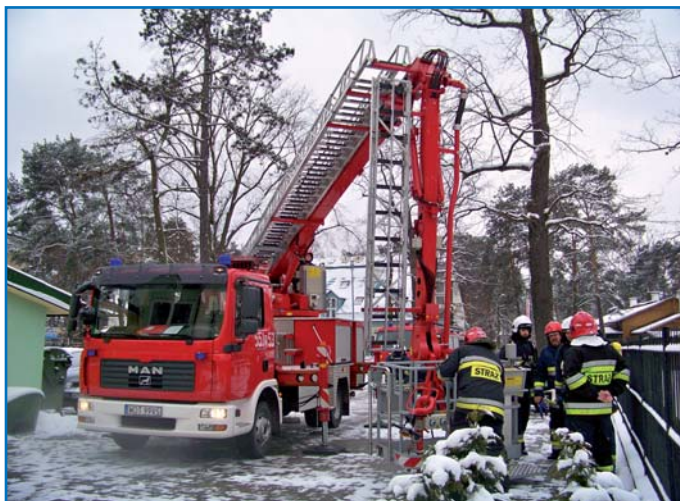
18 lutego odbył się przed Urzędem Miasta pokaz sprawności OSP. Tlumiono pożar i ratowano jego ofiary – jedno i drugie było pozorowane